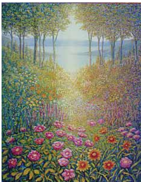
"Pequeña Utopía" Pintura de Carlos Rubinsky

Esta es la definición que leo cuando busco en mi diccionario inglés la palabra "insight": "el poder de usar la propia mente para entender