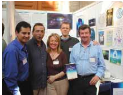
Feria de libros en Londres, GB

El trabajo diario del presidente del CD es el de conectar a personas y recursos para la diseminación del texto y las enseñanzas. Y el miembro local es crucial en esto porque él o ella deben estar en su lugar para adaptar sus técnicas de diseminación a las condiciones