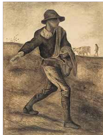
“La siembra”, Vincent Van Gogh, 1881

La palabra diseminación es de origen latino y viene del verbo sembrar. En general,