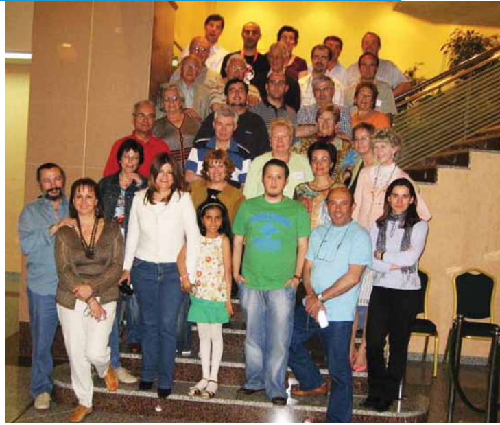
Foto de grupo. Más fotos en http://www.urantia-uai.org/photos/index.html

El Encuentro concluyó oficialmente con la reunión de clausura, donde dimos la palabra a