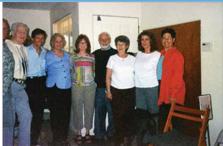
Foto de grupo de Arizona