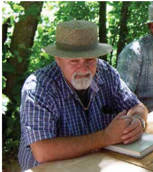
Guy, lors d'un groupe d'étude à Berthier sur Mer.

A UMOISDEMARS 1973, une grande transformation dans ma petite vie s'amorça: étant dans un salon mortuaire, un esprit de fraternité m'animait et j'aimais converser de philosophie avec ceux qui avaient un esprit ouvert. J'avais 30 ans et je cherchais, à travers une vie très mouvementée, des réponses qui n'étaient pas toujours satisfaisantes. Mais voilà qu'une vieille femme toute vêtue de noir, seule, assise dans un coin, me regardait et m'écoutait. Quelqu'un attira mon attention et me fit signe qu'elle voulait me parler. D'un sourire simple, elle me dit: «Les réponses à toutes tes questions se trouvent dans Le Livre d'Urantia .» Les