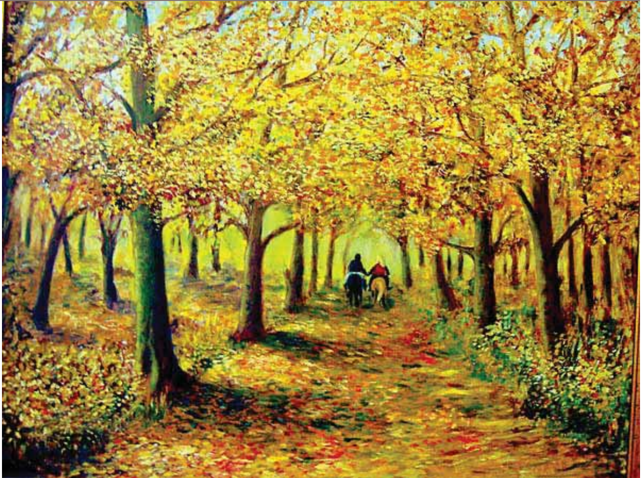
"Automne" Huile sur canevas par Demetrio Gómez (Madrid, Espagne)