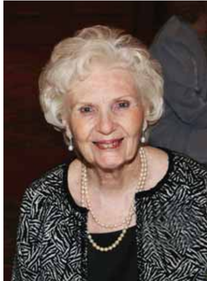
Dorothy à Chicago

Quoi qu'il en soit, en 1968, l'année a commencé par beaucoup de stress et d'incertitude. Mon mari étant malade depuis un certain temps, il était souvent hospitalisé et sans-travail. Sa maladie était très sérieuse et débilitante, et le futur très incertain. J'étais remplie de beaucoup de tristesse, de crainte et de souci. Vers cette période-là, ma mère a commencé à me parler d'un livre qu'elle avait trouvé et qui contenait toutes les réponses; un livre qui avait été écrit par les anges et qui parlait de tout, au sujet de Jésus et de l'univers entier.