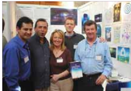
Foire du livre à Londres, R.U.

Le Comité de dissémination a également créé un projet de Foire du livre, en réponse à un de ses mandats inclus dans la Charte. Ce projet de l'AUI est offert conjointement avec le service au lecteur de la Fondation Urantia. Ça encourage des membres à donner des présentations dans des lieux appropriés, par exemple dans les conventions de bibliothécaires et dans les expositions de livre. Un ensemble comprenant