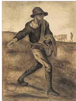
"Le Semeur" Vincent Van Gogh, 1881

Certaines des premières questions évidentes auxquelles le président du Comité de dissémination devait répondre étaient: quels enseignements le Comité de dissémination devrait-il disséminer? À qui? De quelle manière? Et comment est-ce que le travail du comité d'éducation de l'AUI et du comité des groupes d'étude empiètent-ils sur le travail du Comité de dissémination et comment se relient-ils aussi à ce comité? Il y eut une étude soutenue et de longues discussions avec une gamme étendue de membres et de dirigeants, une épuration des idées qui s'est poursuivie pendant deux ans alors que plusieurs stratégies furent rejetées ou adoptées.