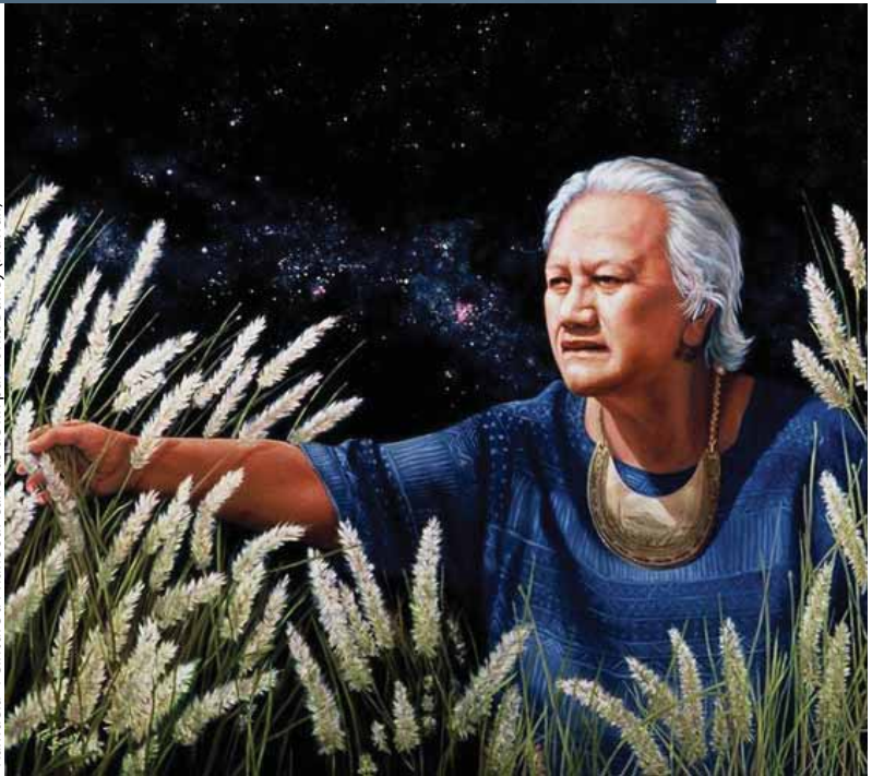
"Kamuela" Peinture à l'huile sur canevas de lin par Tonia Baney (Hawaii)