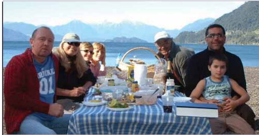
Pique-nique à Lago Todos Los Santos (Lac des Saints)