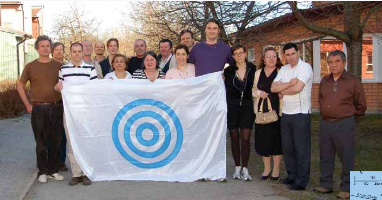
Photo de groupe. Encore plus de photos de l'inauguration au http://www.urantia-uai.org/photos/index.html