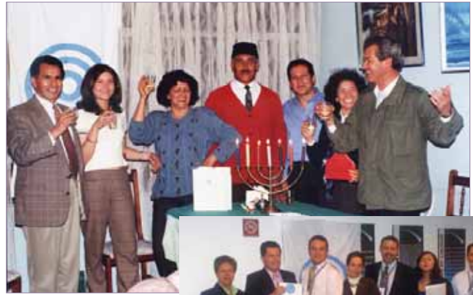
Photo de groupe no. 1 en haut Photo de groupe no. 2 à droite