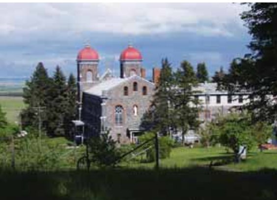
Monastère Ste-Gertrude à Cottonwood, Idaho

Au bas de la colline, à une distance d'un jet de pierre du monastère et à l'intersection d'une route de campagne, se trouve une vieille maison de ferme convertie en un petit centre de conférence. Il comprend une demi-douzaine de salles de bain, une très grande pièce de séjour, une cuisine fonctionnelle et peut accommoder une vingtaine de personnes. Cette vieille habitation avec sa vue imprenable