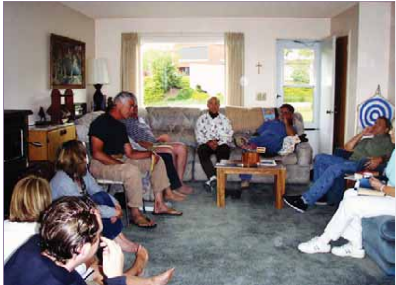
Photo de groupe. Pour plus de photos, voir: http://www.urantia-uai.org/photos/index.html

sur les prairies en contre-bas, fut pendant onze années consécutives pour la fin de semaine du jour du Souvenir, le lieu de rassemblement de l'Association Urantia de l'Idaho.