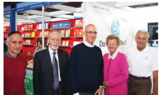
Présentation du Livre d'Urantia dans la plus grande foire du livre dans le secteur de langue allemande en Allemagne