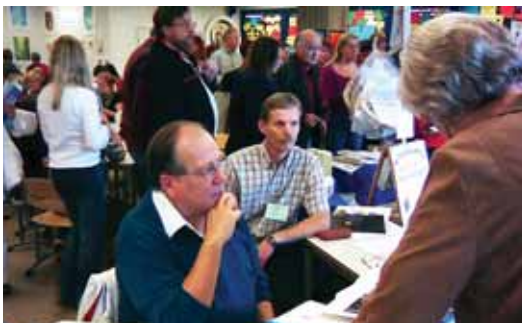
Deux expositions: en haut, l'exposition de "Je Suis" en bas, exposition de "L'Esprit et la Connaissance"

RAIMO ALA-HYNNILÄ gadonia@kolumbus.fi Suomen Urantia-seura ry.