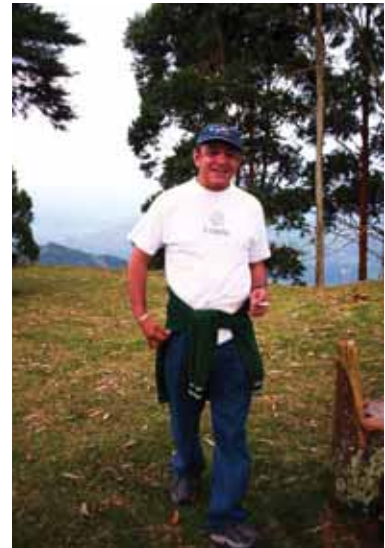
(16 décembre 2006) Vice-président, Association Urantia de Medellín